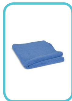
Flanela de microfibra