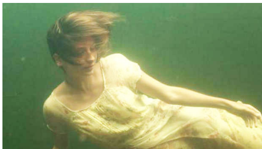
ELENA (2012, 82'), de Petra Costa

Sobejar significa exceder os limites do necessário, ser demasiado. O curta é um documento lírico e sensorial de uma jovem sobre suas crises de ansiedade, sobre a medicalização da vida e sobre suas buscas de cuidar de si.